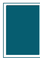
1/1-Seite 200 x 287 mm