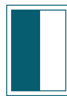
1/2-Seite hoch 98 x 287 mm