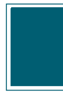
1/1-Seite 200 x 287 mm