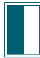
1/2-Seite hoch 98 x 287 mm