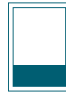
1/4 Seite quer 200 x 68 mm