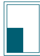
1/4-Seite hoch 98 x 141 mm