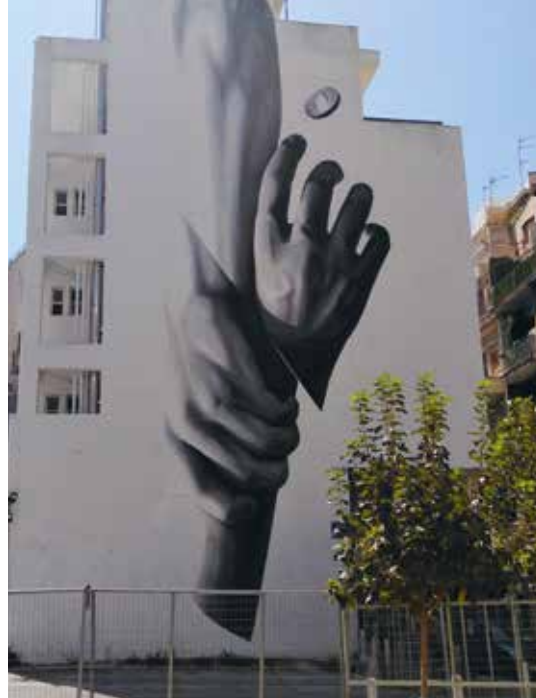
Wake up by INO, Emmanouil Benaki Road, Athens.

creating the self-governing park of Navarino , the adjacent wall was covered with a giant painting. It shows plants overgrowing and tearing down the buildings of a dull grey city. Their seeds and roots lie within the people's heads painted in green.