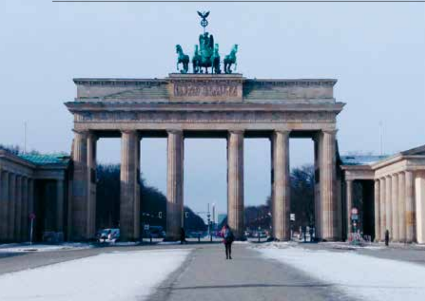
Impressionen von unserer Autorin aus Berlin vom Februar 2021

big renoviert. Die Kerne der eingemeindeten Dörfer sind mit Rathaus, Kirche, etc. noch in der Stadt zu erkennen. 1910 wurden alle kleineren Orte im Umkreis von Berlin eingemeindet. Die Bevölkerung Berlins verdoppelte sich auf einen Schlag und es war nun genug Platz da, für ein weiteres Flächenwachstum der Stadt.