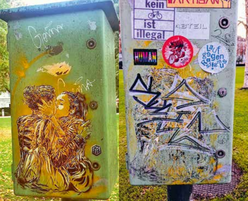
The tooth of time: The Kiss by C215, Bäckeranlage, Zurich, before and after.