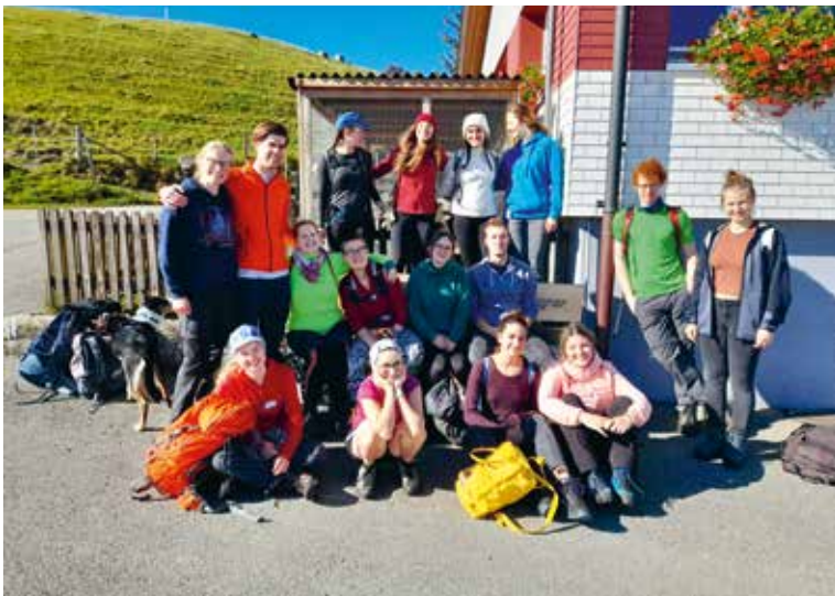
Der Vial auf Wanderschaft.

Egal ob wegen Party, Wanderung oder beidem, alle sind müde, aber glücklich Heim gekommen. Bis zum nächsten Mal!