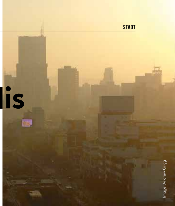
Sunrise in Seoul

is a doctoral student in biogeochemistry. He enjoys travelling to cities around the world and marvelling at the way humans have adapted their environments.