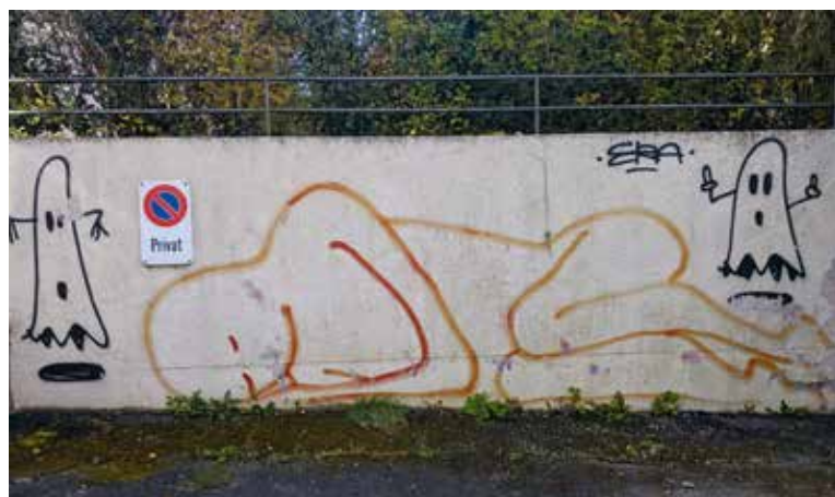
Were the ghosts part of the original painting or added later by a second artist? Birmensdorferstrasse, Zurich.

In conclusion, we need more street art. It boasts cities' attractiveness, inspires reflection and creativity, makes us attentive to our surroundings, symbolises the public character of urban life and expresses human nature. But most importantly, it makes our everyday walk through the streets more beautiful. And beauty – as a famous quote from Dostoyevsky's "Idiot" states – will save the world. We really need it.