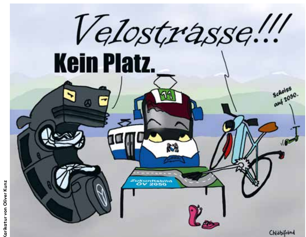
Karikatur von Oliver Kunz

Für Velofahrende ist Zürich ein gefährliches Pflaster. Doch es gibt Bewegungen, die das ändern wollen, und konkrete Pläne, um die Situation zu verbessern. von Anna Weber