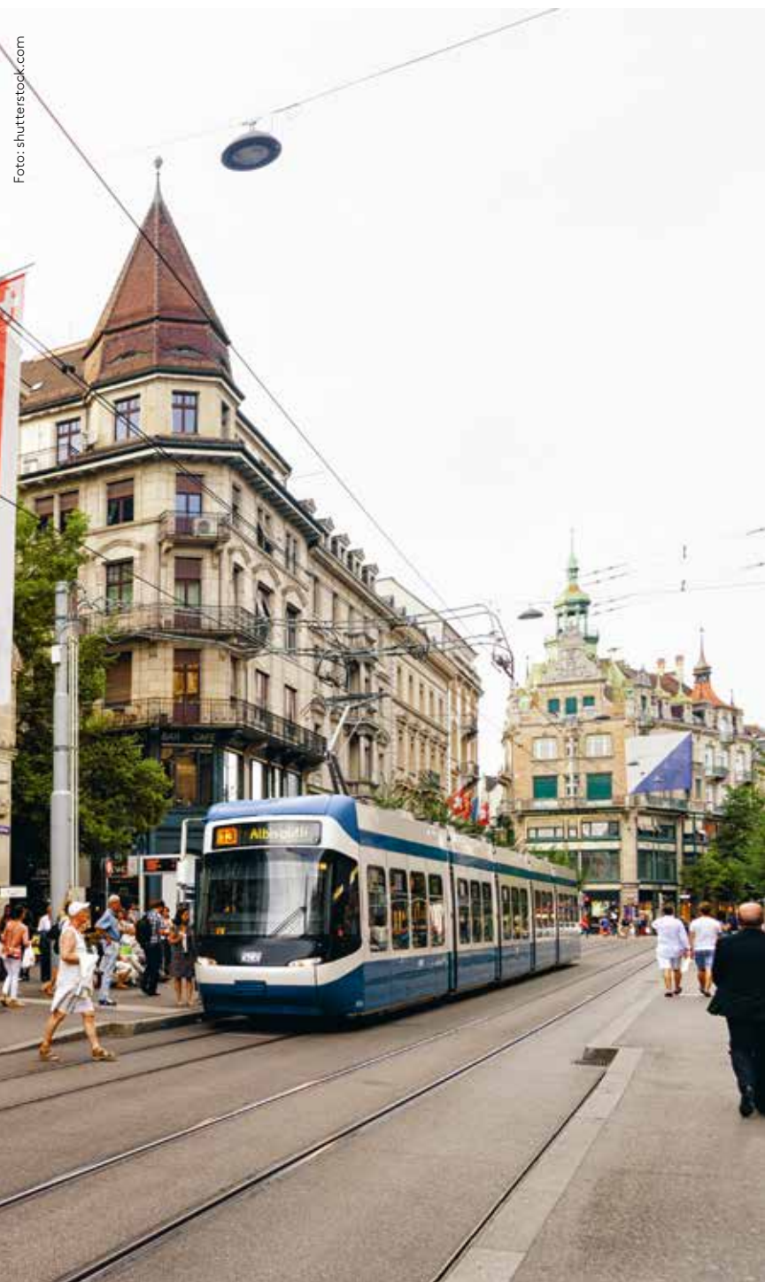
Nicht alle können sich den Luxus der Bahnhofstrasse leisten.

Während die beschriebenen Indikatoren und Schicksale einen zermürbenden Eindruck hinterlassen können, gibt es auch Gründe für Hoffnung. In seiner Arbeit wirbt der kolumbianisch-französische Stadtforscher Carlos Moreno zum Beispiel für eine «15-Minuten-Stadt», in der Wohnen, Arbeiten, Einkaufen, Gesundheitsversorgung, Ausbildung und Freizeit innerhalb dieses Zeitradius liegen. «Lebendig bleiben Städte, die auf ökologische, ökonomische und soziale Werte setzen», sagt Moreno. Ansätze hiervon lassen sich in Paris oder anderen Metropolen entdecken: Die Transformation, Städte mit Hinblick auf Soziales und Nachhaltigkeit neu zu gestalten, wird in Hinblick auf die Chancen und Probleme des Stadtlebens immer prävalenter, wie es sich auch in Zürich zeigt. «Das soziale Stadtleben kennt viele Akteurinnen und Akteure – allen voran die Menschen in der Stadt Zürich, die sich für die Gemeinschaft und das Gemeinwohl engagieren und somit das soziale Stadtleben wesentlich prägen», heisst es in einer Broschüre der Stadt Zürich von Anfang dieses Jahres, und die meisten würden dem wohl zustimmen. Mit Quartierprojekten, lokalen Vereinen oder globalen Organisationen gibt es zahlreiche Möglichkeiten im Kleinen das Grosse zu verändern. Ganz nach der Vision in der Broschüre «Alle machen Zürich! Die Menschen in Zürich gestalten ihren Lebensraum und prägen das Stadtleben», können wir uns alle für ein soziales Miteinander einsetzen und alle mit einbeziehen. Von alleine geht das natürlich nicht. Los geht's.