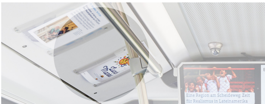
Plakate im ETH eLink